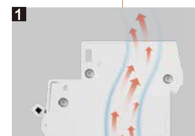
“S”型散热槽 快速而有效地散热