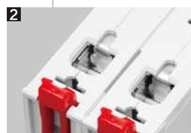
隧道式接线端子 导线压接更安全牢固