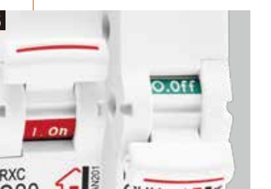
开关指示 开闭合指示更明显