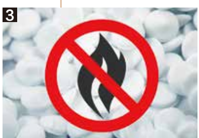
阻燃外壳 保障产品的安全使用