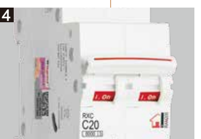
弧形手柄 贴合手指，操作轻松